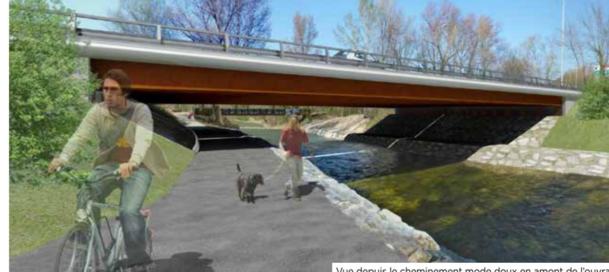
Vue depuis le cheminement mode doux en amont de l'ouvrage

Mais, s'il vous manque une information, si vous vous interrogez sur un élément du projet... n'hésitez pas à solliciter AREA via le site internet (A43.aprr.com) de l'opération!